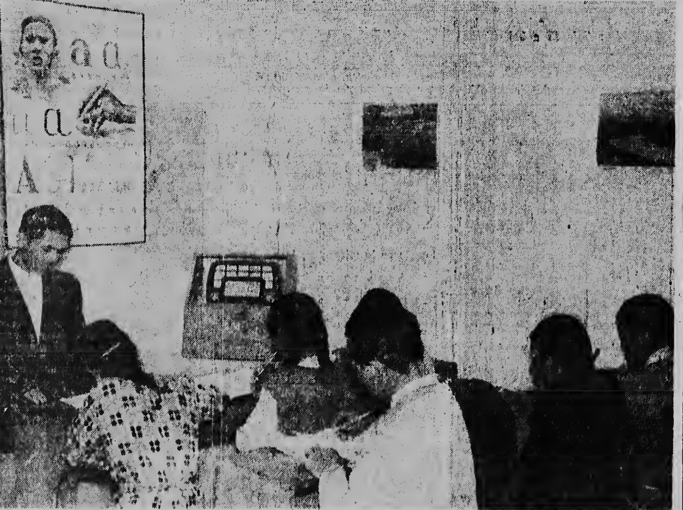
Awe nos ta publica den nos corant un articulo na Spanjo tocante ayudo tecnico en Unesco ta dunando pa contribui un diferente sistema di enseñanza nan henter mundo. Riba e foto aki nos lectionan por mira un clase di school na Colombia en radio. E sistema di school aki a ser lanza pa di e medio el pa via di e radio por alenzu tur e aldeanan y comunidatnan den montañanan di Andes. Den dje school aki e studiantenan ta tumando un les transmilt pa radio Sutatenza, hopi milja leury door di un maestro cu nan no por welta.

Cobardia: Cobardia ta mama di crueldad. Un cobarde no ta sinti remordimiento di curazon pa mala mil hende, pero e ta tembla di temor i ansia ora cu e mes ta ser menaza seriamente pa muri. Un cobarde ta muri hopi bez prome cu e ta morto en realidad, mientras un heroe ta muri un bisha sol i siembargo e ta queda inmortal.